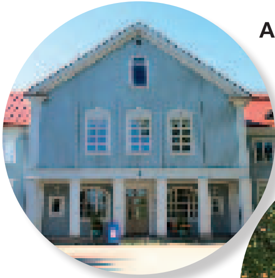
A -Ahlmanin Kartano