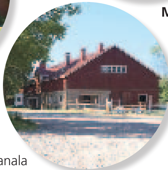
E -Wanha talli, kuttula ja kanala