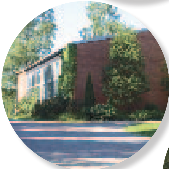
B - Auditorio, juhlasali, oppilaitoksen hallinto ja opettajien huoneet